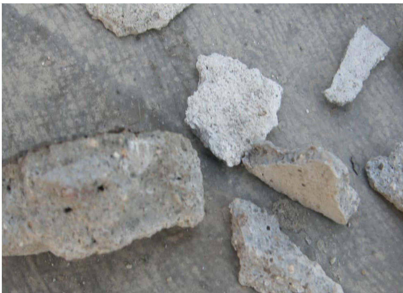
顶楼可以是偷工减料？何不检测？何时落实？造成渗水落水严重。国家的屋面工程是这种标准？