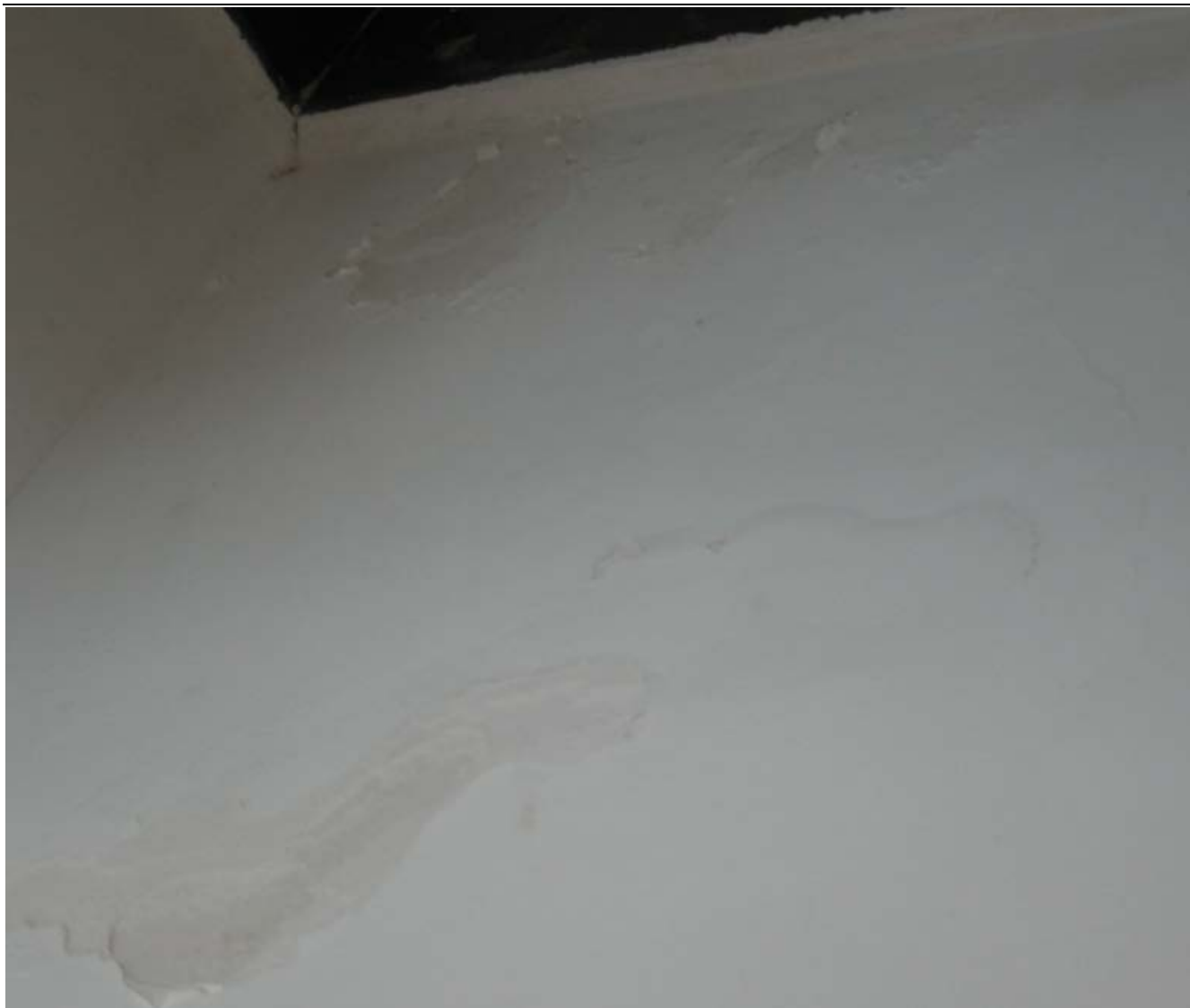
屋内墙角都有漏水渗水现象