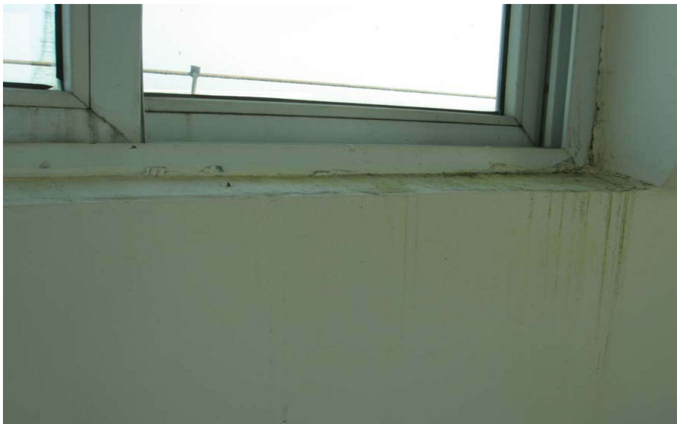
最顶层角楼窗漏的都长了青苔，墙体也漏水渗水