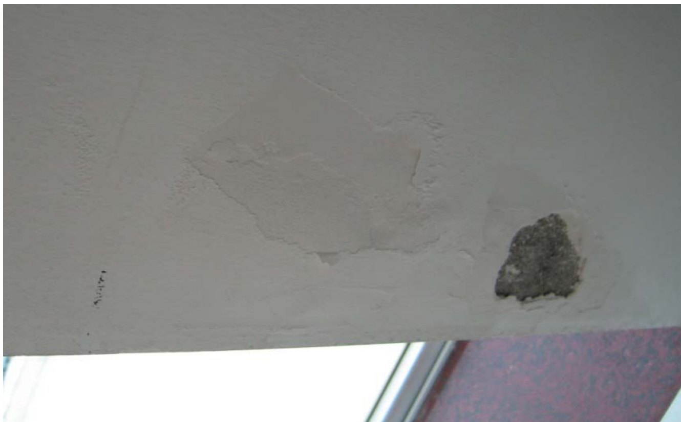
阳台墙体漏水渗水造成的。