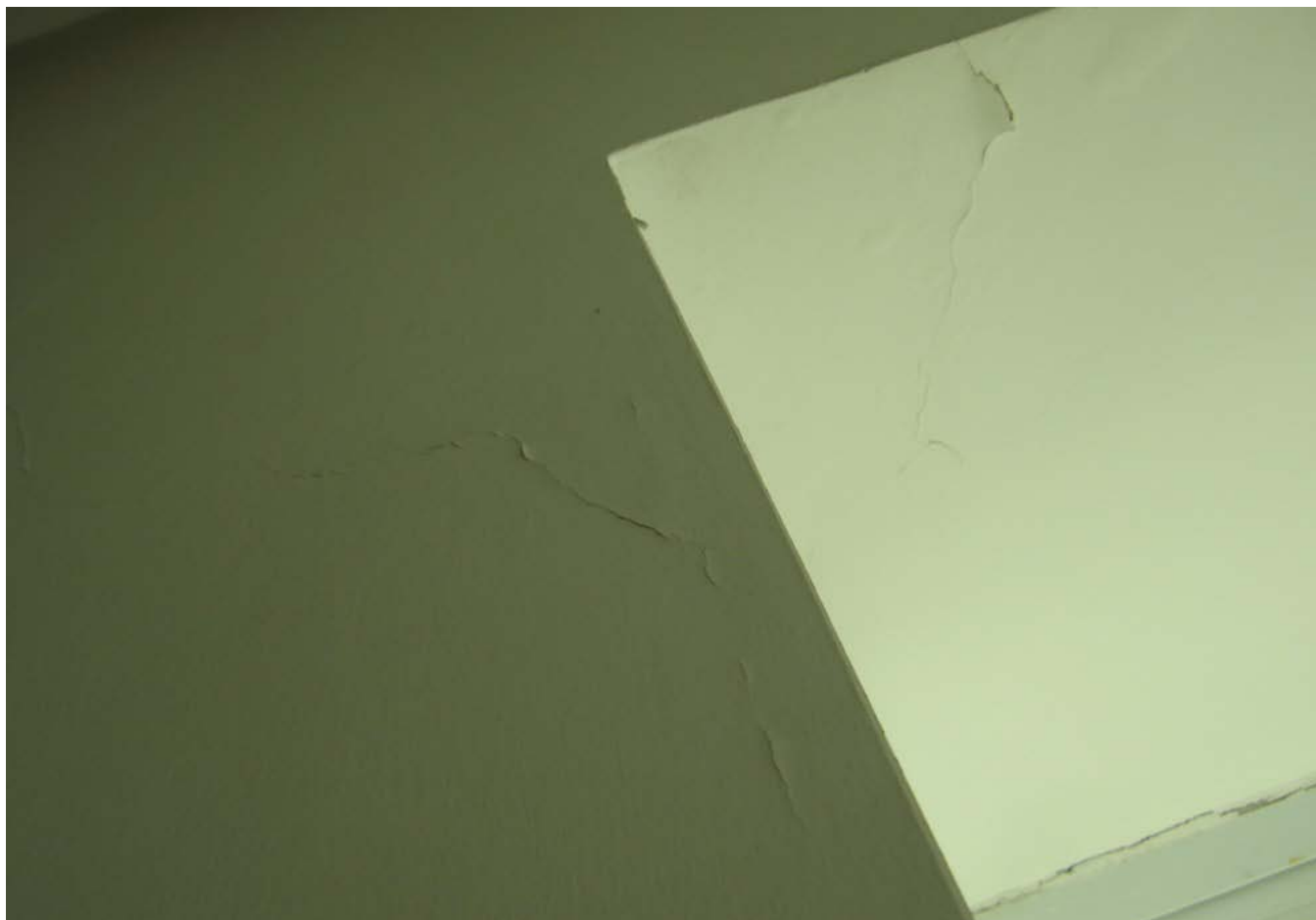
窗周围的墙体裂开并漏水渗水