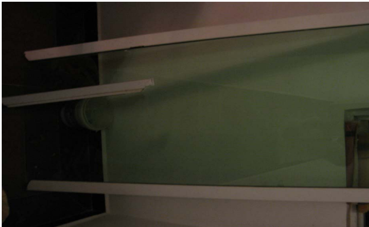
2010年10月2日早上七点B座3单元702阳台的大门自然倒下