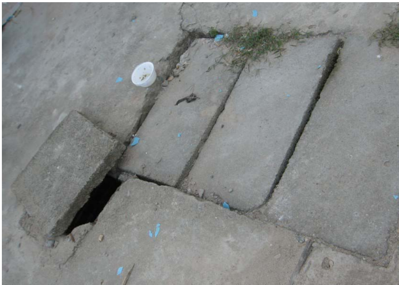
沙井盖何以安全？何有合格证？与墙体距离何以安全？