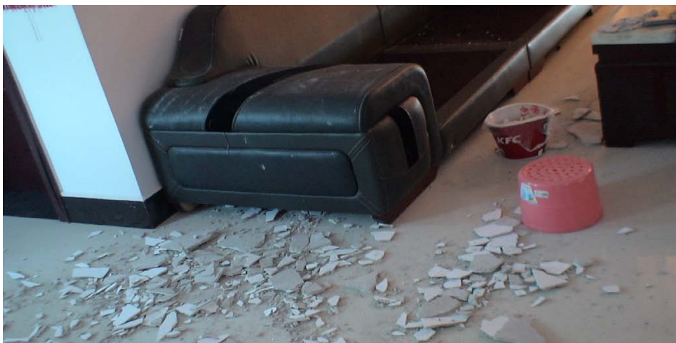
A座4单元701天花板塌下来了

楼道,现在出现二道裂痕?为何不检测?为何不按规范要求修缮?永丰县规划建设局为何要舞弊?渎职?这种态度为何?这种裂痕进度造后果何以挽回?何为温差?工程技术就这种解释?这就是科学?专业?(有些地方根本不是水平平行裂痕)