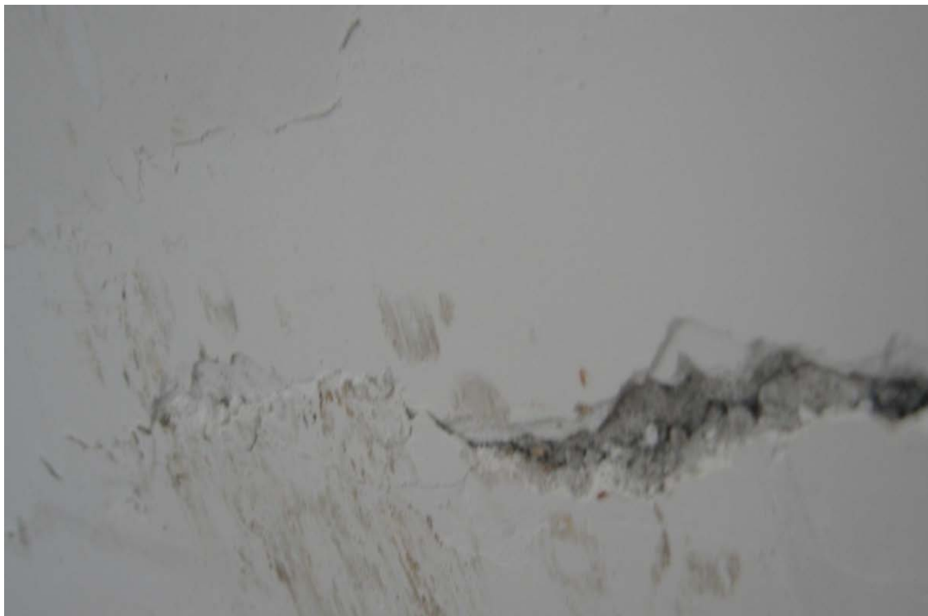
双裂痕。为何不检测？为何？