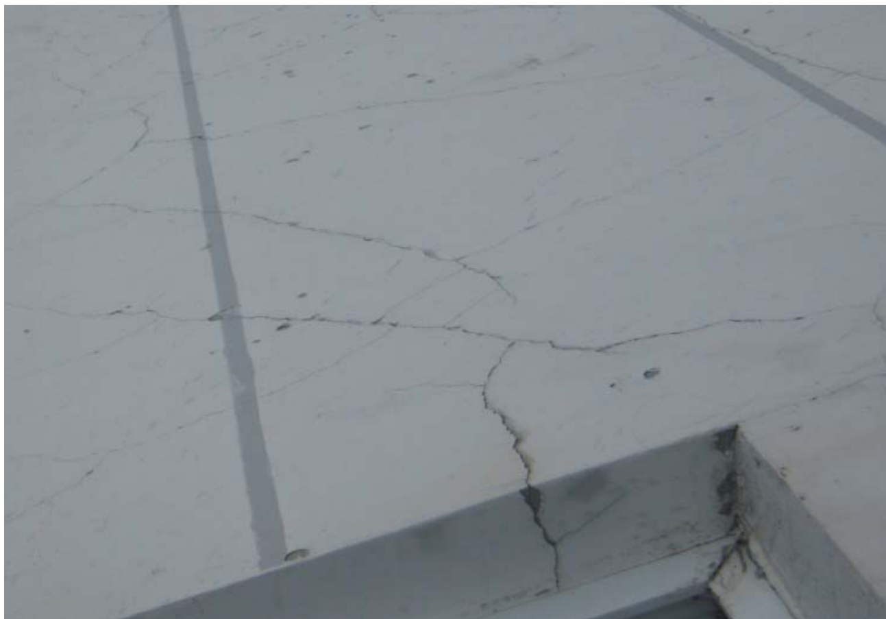
外墙在省长信箱回复解决？何以解决？这是什么？